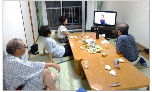
交歓朗読会ビデオで反省会